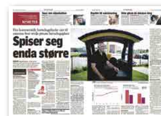
Klassekampen i går.

■ På torsdag kan du lese om hvordan det gikk til at Halden ble et mekka for private barnehager – og hva som er konsekvensene.