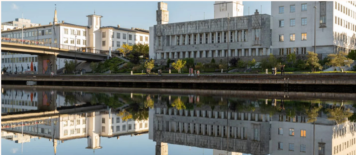
EiendomsMegler 1 Sandvika